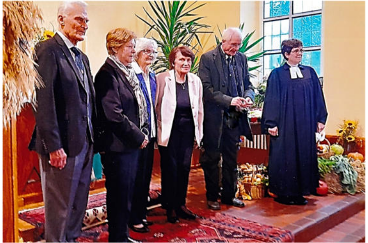
M. Niestroy

Manche Kirchenbesucher werden den Chor vermissen, hat er doch durch das Kirchenjahr immer wieder die Gottesdienste bereichert.