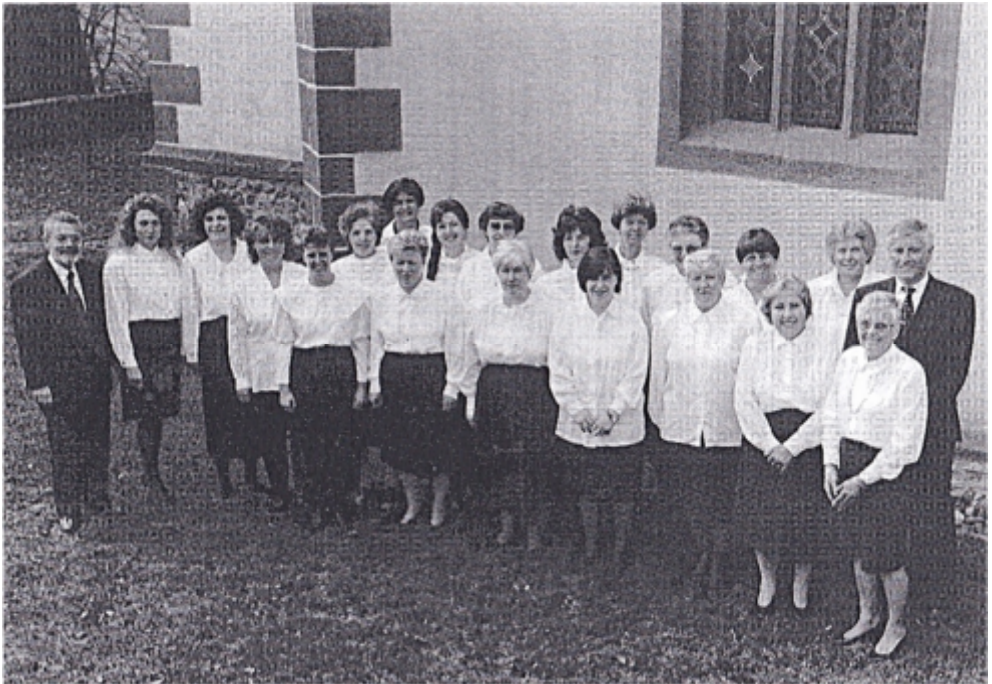
Der Chor 1996

Der evangelische Kirchenchor Heiligkreuz konnte im Jahr 2021 auf sein 100-jähriges Bestehen zurückblicken. Aus gegebenem Anlass findet nun der Festgottesdienst am Sonntag, dem 29. Mai in der altertümlichen Kirche zu Heiligkreuz statt. In diesem Festgottesdienst werden auch langjährige engagierte Sängerinnen geehrt. Die Gemeinde ist zu diesem besonderen Gottesdienst herzlich eingeladen. (a.w.)