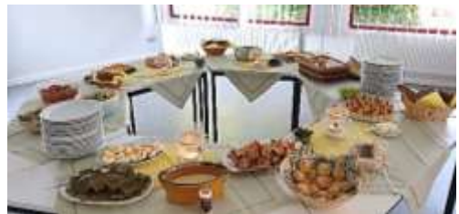
S. Schmitt / Bilder: Anja Krinke

Wir danken allen Helferinnen und »Kaltmamsellen« und freuen uns auf das nächste Mal!