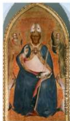
„Der Heilige Martin von Tours auf dem Thron“, Bicci di Lorenzo (1373–1452)

Ungewöhnlich ist, dass sein Beerdigungstag zu seinem Gedenktag erhoben worden ist und nicht sein Sterbetag. Der Grund: Im Mittelalter endete das bäuerliche Arbeits- und Wirtschaftsjahr am 11. November, dem dann eine 40-tägige Fastenzeit vor Weihnachten folgte. Dem entspringt auch der Brauch, an diesem Festtag eine Martins-Gans zu braten. 1483 wurde an eben diesem Tag ein Junge, der tags zuvor geboren war, in Eisleben auf den Namen des Heiligen getauft: Martin Luther.