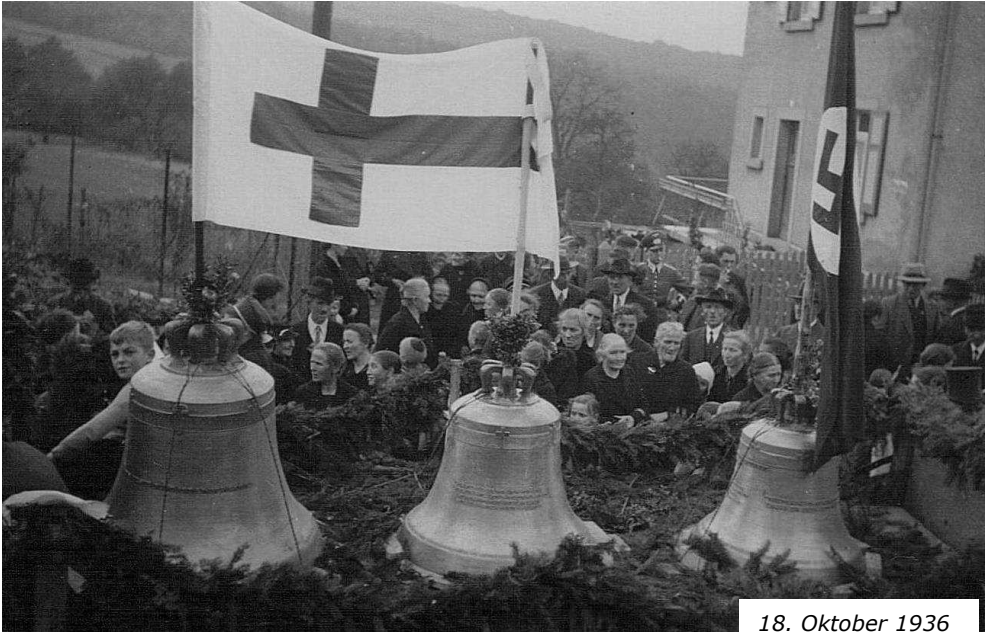
18. Oktober 1936

Die ersten Glocken, die von der Glockengießerei Bachert in Karlsruhe gegossen worden waren, wurden eine Woche vor der Einweihung der Kirche in einem Festzug, eskortiert von Reitern, von der Daummühle aus zur neuen Kirche gebracht.